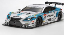
RC KIT 1:10

Scatola di montaggio RC, scala 1:10 del Pick-Up Amarok prodotto da Volkswagen. Il kit utilizza il telaio Cross Country 4WD CC-01 ed include motore 540 e regolatore elettronico TBLE-02S. Un serie di Optional permettono la personalizzazione.