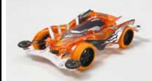
Immagine prototipo mini4WD

La Slash Reaper a breve disponibile nella versione Orange Clear che utilizza il telaio VS. Il modello dispone di body trasparente arancio, telaio bianco, cerchi neri con gomme arancio largo diametro. Motore e rapporti 3,5:1 inclusi. Optional disponibili.