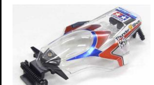
Immagine prototipo RICAMBI mini4WD

La Astro Boomerang a breve disponibile nella esclusiva versione Clear Red prodotta in edizione limitata. Il modello utilizza il telaio Super-1 con gomme bombate rosse e cerchi leggeri bianchi. Motore e Rapporti 4:1 inclusi.