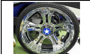
Immagine indicativa RICAMBI mini4WD

Versione Limited Edition per il motore Hyper Dash PRO realizzato per il Japan Cup 2016. Il motore sviluppa 21.200 giri con una coppia di 1,9mN-m. Compatibile con tutti i telai delle mini4WD-PRO che utilizzano motori a doppio pignone.