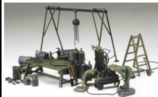
Immagine prototipo KIT 1:35

Fedele riproduzione, in scatola di montaggio scala 1:35, del carro US M10 Destroyer nella versione Mid production dotato di canna da 76,2mm. Il modello è riprodotto nei minimi dettagli ed include 3 figure.