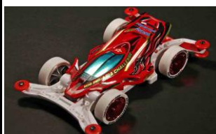
Immagine prototipo mini4WD

Esclusiva versione Japan Cup 2016 per la Raikiri con livrea bianca. Il modello utilizza il telaio MA delle mini4WD-PRO ed include motore doppio pignone e cerchi gialli con razze "Y" e gomme super hard basso profilo. Edizione limitata.