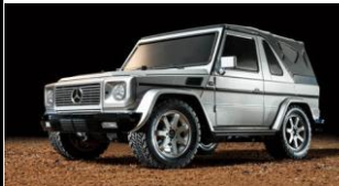
KIT RC 1:10

I cerchi "A-Spoke" riproducono la forma dei cerchi installati nella mini4WD Aero Avante in scala 1/1 che Tamiya ha realizzato per le promozioni in Giappone. Compatibile con tutte le mini4WD dotate di gomme low profile.