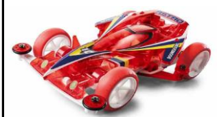
Immagine prototipo mini4WD

Versione speciale limited edition per l'Asia Challenge 2016 della Aero Thunder Shot dotata del telaio AR. La carrozzeria nel colore rosso dispone dei decal con livrea della bandiera di Hong Kong. Gomme con stampato il logo Asia Challenge 2016.