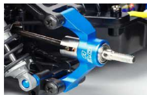
OPTIONAL RC 1:10

Versione rinforzata per il telaio inferiore del modello TT-02. Compatibile con telai TT-02, TT-02B, T-02D, TT-02R, TT-02 Type S e TT-02T. Il colore blu aggiunge un tocco di personalizzazione al vostro modello.