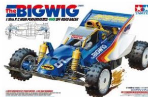
AUTO RC 1:10

Set di tubetti da 4mm assortiti in 5 differenti altezze: 1,5 - 3 - 6 - 6,7 - 12mm. Realizzati in alluminio anodizzato Blu sono utilizzabili con tutte le mini4WD. Prodotti in edizione limitata.