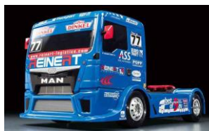
AUTO RC 1:14

Tamiya ha il piacere di annunciare la riedizione aggiornata 2017 di una delle più popolari auto RC prodotta negli anni '80. La Bigwig 2017 include motore GT-Tuned realizzato espressamente per questo modello. Edizione limitata.