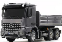
RC KIT 1:14

Versione del rally del Messico 2004 per la Subaru Impreza. Il modello, scatola di montaggio RC in scala 1:10, utilizza il telaio 4WD con trasmissione cardanica TT-01E di semplice costruzione e limitata manutenzione. Reg.TBLE02S incluso.