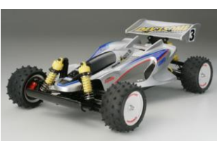
RC KIT 1:10

Coppia di cerchi in alluminio per i telai Super X e Super XX dotati di gomme basso profilo. Il set include fermi cerchio in plastica. Peso 3,3g cad. Compatibile con Telai Super X e Super XX.