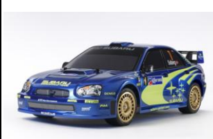
RC KIT 1:10

Scatola di montaggio, radiocomandata con motore elettrico, della Manta Ray nella versione 2018. Trasmissione cardanica 4WD, sospensioni indipendenti con ammortizzatori idraulici. Motore e regolatore TBLE-02S inclusi.