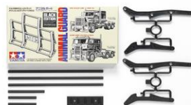
ACCESSORI CAMION RC

Esclusiva versione nel colore bianco per lo spoiler dei camion RC 1:14. L'inclinazione dello spoiler è regolabile. Il set include la minuteria per l'installazione. Compatibile con King Hauler, Glob Liner e Grand Hauler.