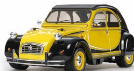
KIT RC 1:10

Questo modello riproduce la NSU nella livrea Jagermeister. Il kit in scatola di montaggio radiocomandato utilizza il telaio 2WD a trazione anteriore M-05. Carrozzeria in policarbonato dettagliata. Motore e regolatore elettronico inclusi.