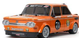
KIT RC 1:10

Tamiya introduce un nuovo concetto per i modelli RC da divertimento. La Dancing Rider è una moto a tre ruote che grazie all'esclusivo telaio T3-01 stupirà per la semplicità di guida. Impianto RC venduto separatamente.