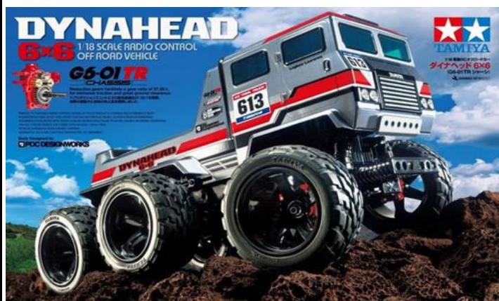
KIT RC 1:18

Nuovo modello ispirato alle grandi motrici utilizzate per le faticose competizioni off road. L'affidabile meccanica del telaio 6X6 G6-01TR Tamiya, personalizzazione del telaio G6-01TR, garantisce un funzionamento divertente ed affidabile.