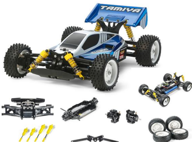
KIT PARZIALMENTE PRE-ASSEMBLATO RC 1:10

La Neo Scorcher parzialmente pre-assemblata offre una nuova opzione ai principianti. Il kit viene fornito con varie parti assemblate e consente agli appassionati che si vogliono avvicinare al mondo dei modelli RC elettrici off-road di disporre di un modello semplice e rapido da costruire . Le parti pre-assemblate sono: