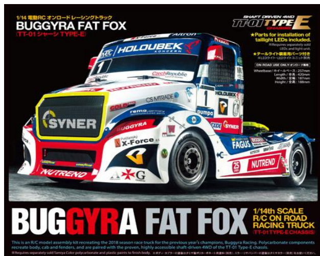
KIT RC 1/14

Un nuovo modello si aggiunge alla linea dei Camion Racing elettrici. Il modello utilizza il telaio TT-01E 4WD con trasmissione cardanica di semplice costruzione e limitata manutenzione.