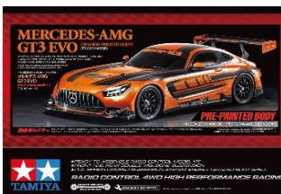
KIT RC 1:10

Edizione limitata. Carrozzeria pre-verniciata Metallic Orange già forata e pronta al montaggio, perfetta per iniziare subito a correre. Telaio 4WD TT-02 stabile e versatile, gomme slick, Cerchi mesh neri E dettagli realistici in ABS. bumper protettivo in uretano incluso. Ideale per chi vuole un modello performante e d'impatto senza dover verniciare. Lunghezza: 454mm, larghezza: 189mm, altezza: 120mm. Passo: 251mm (corto). ESC INCLUSO -