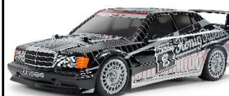
KIT RC 1:10

Rivivi la leggenda del motorsport con la Mercedes-Benz 190 E 2.5-16 EVO II 1991 su telaio TT-02! Carrozzeria pre-verniciata nero/argento, finestrini smoke e dettagli ABS che donano realismo premium. Telaio 4WD stabile e intuitivo, ideale per principianti ed esperti. Cerchi silver con gomme slick per grip sportivo. Un modello esclusivo per veri appassionati, pronto per pista e collezione. Lunghezza: 445mm Larghezza: 184mm. Altezza: 137mm. Passo: 257mm. ESC INCLUSO -