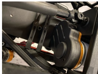
Riduttore trasmissione per arrampicate