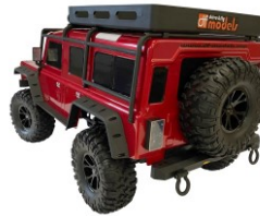
Carrozzeria dettagliata con LED controllabili da trasmettitore