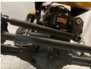
Servocomando con ingranaggi in metallo