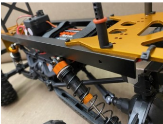
Ammortizzatori ad Olio con parti in alluminio