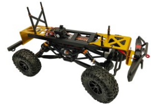
Telaio con altezza da terra estrema per prestazioni da vero Crawler