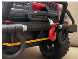
Verricello con cavo in acciaio controllabile dal trasmettitore