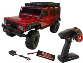
Set completo RTR con batteria e Caricabatterie 220V

Nuovo Telaio con: LED, cambio 2 vel, verricello tutto controllabile dal trasmettitore 5 canali