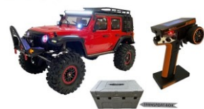
DF-4S PRO Crawler

I differenziali del modello possono essere bloccati o sbloccati attraverso il trasmettitore, la trasmissione alle ruote ulteriormente ridotta da un cambio per una perfetta erogazione della potenza. Il radiocomando è un altro punto forte. Sul display LCD è visualizzato carica delle batterie del trasmettitore, potenza di trasmissione, marcia utilizzata, angolo di sterzata, posizione acceleratore in %, stato dei trim. Il volante è dotato di una leva aggiuntiva con la quale è possibile il "controllo con una sola mano"! Contenuto del set: - Crawler RTR 1:10. - Radio 2,4 GHz. - Manuale istruzioni. Viene fornito in una elegante confezione rigida per facilitarne il trasporto. Per il funzionamento sono richiesti: batteria 7,2V NiMH o 7,4V LiPo e relativo caricabatterie.