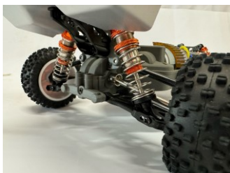
Ammortizzatori idraulici in alluminio con molle regolabili..