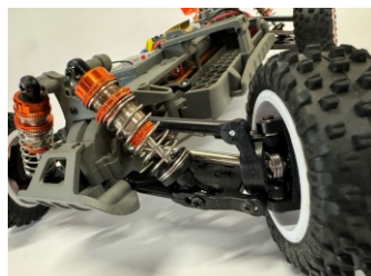
Cardani omocinetici e paraurti rinforzato.